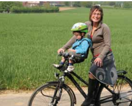
Kinderstoel vooraan op de fiets