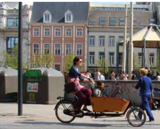
Een 2-wieler bakfiets