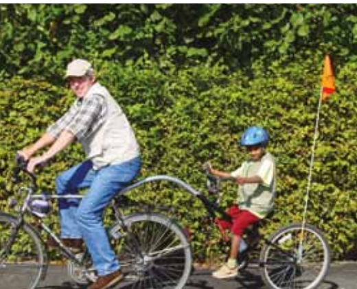
Aanhangfiets met koppelingspunt onder het zadel