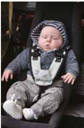
Hangmat voor een baby in een fietskar

Baby's hebben zwakke nekspieren en een groot, zwaar hoofd in verhouding tot de rest van hun lichaampje. Ook is er ruimte tussen hersenen en schedel om de groeikansen van de hersenen te verzekeren. Wanneer je een baby hevig schudt, ontstaat er een soort whiplashbeweging van hoofd en hals door het fors naar voor en achter bewegen van het hoofd en de hersenen bewegen binnenin de schedel. Dat fenomeen heeft bovenstaande letsels tot gevolg.