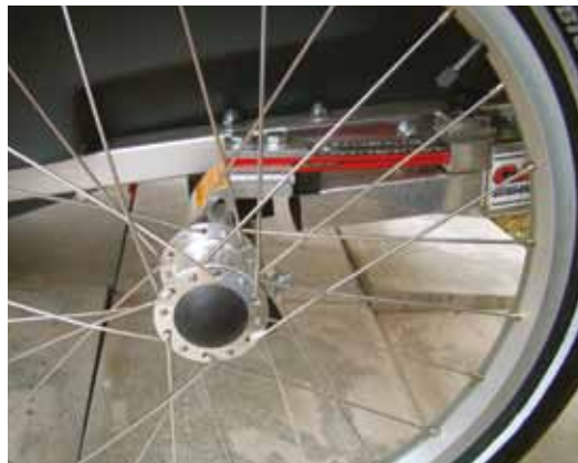
Voorbeeld van vering aan een fietskar