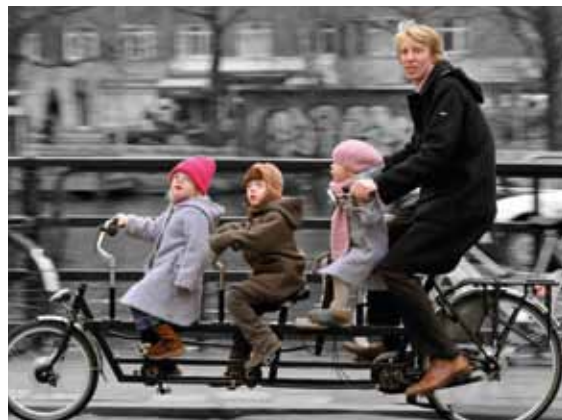
Familietandem (cc creative comments)