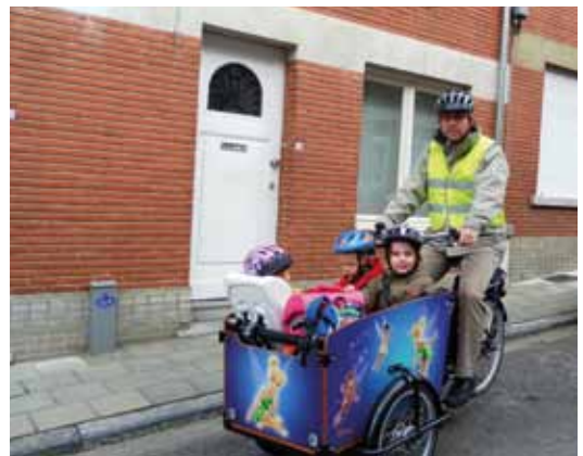
Een 3-wieler bakfiets