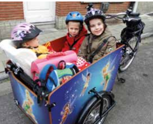
Met 3 kindjes in de 3-wieler bakfiets