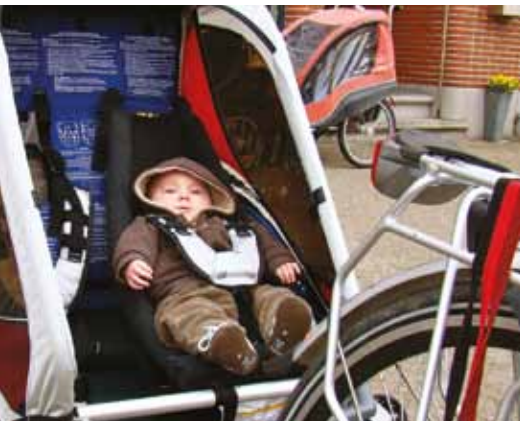
Hangmatje voor een baby in een fietskar

Het voordeel van de fietskar is dat bij een val de fietskar blijft staan, terwijl bij een fietszitje of bakfiets de kinderen mee omvallen. Uit onderzoek blijkt dat de fietskar een veiligere vervoerswijze is dan het fietszitje. De kooiconstructie van de fietskar beschermt de kinderen en zorgt ervoor dat bij botsingen met een auto de fietskar wegschuift in plaats van omvalt.