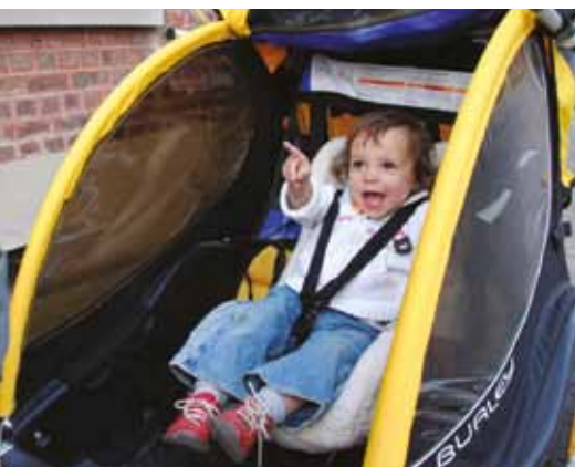
Peuterstoel in een fietskar

Winther Dolphin fietskarren: http://www.winther-bikes.com/