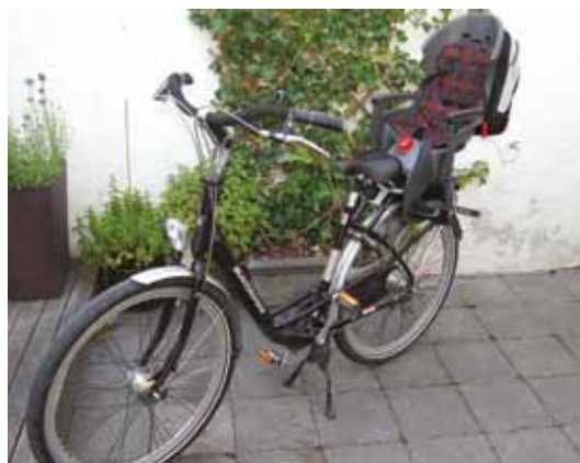
Fiets met dubbele standaard

De verkeerswet zegt dat als je een passagier op de fiets wil vervoeren, je fiets uitgerust moet zijn met een speciaal daarvoor ingerichte zitplaats . Zo niet, is het vervoeren van een passagier verboden.