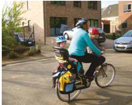
Fietsstoeltje achteraan op de fiets