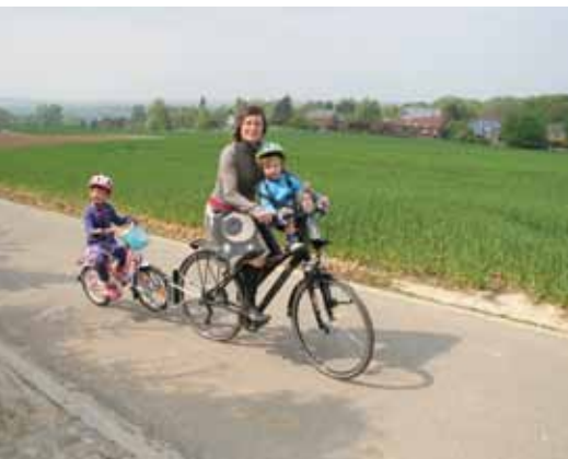
Fietsstoeltje vooraan en fietsstang voor het aankoppelen van een kinderfiets

Trail-gator: http://www.trail-gator.com/