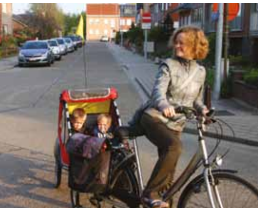
Met 2 kindjes in de fietskar